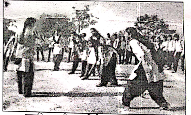
महाविद्यालयीन मुलींची कबड्डी स्पर्धा