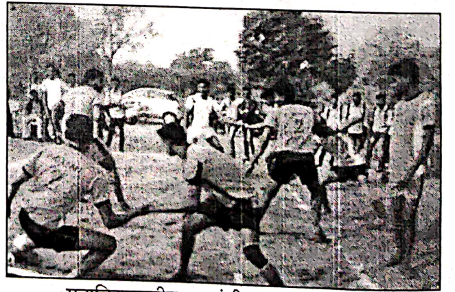
महाविद्यालयीन मुलांची कबड्डी स्पर्धा